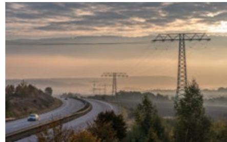
Der Zubringer von Pirna zur A4