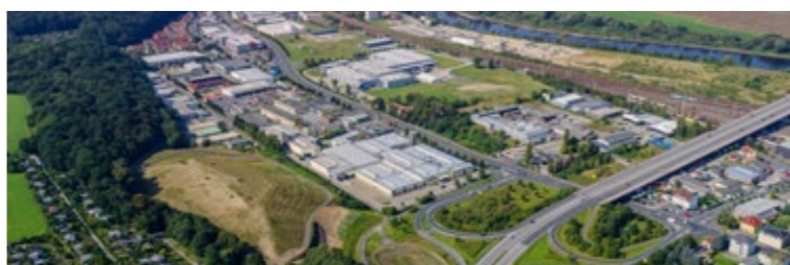
Gewerbegebiet an der Elbe (Pirna-Heidenau)