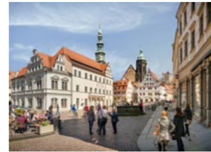
Historischer Marktplatz zu Pirna