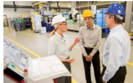
Neue Technologien, erfahrene Arbeitskräfte