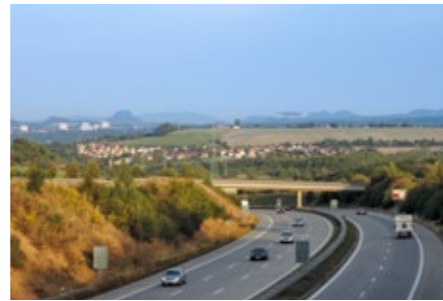
Autobahn A17 Prag – Dresden