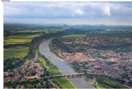
Blick über Pirna in die Sächsische Schweiz